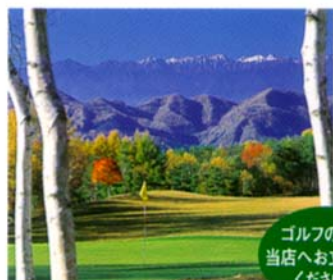
名門・長野カントリークラブ