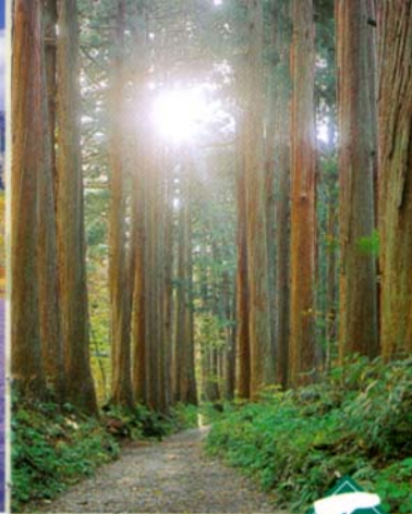
幽玄な空気が広がる