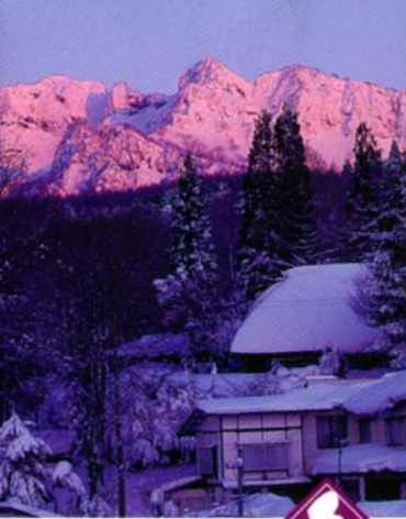
静まり返る、透明な空気