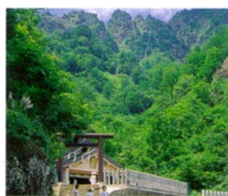
天の岩戸伝説ゆかりの神々を祭る戸隠神社