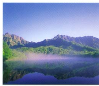
四季折々の姿が美しい鏡池