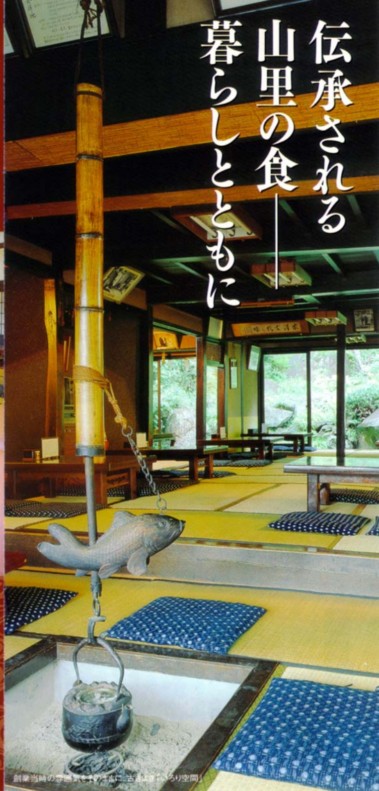
創業当時の雰囲気と、ともに「古きよき」いろり空間