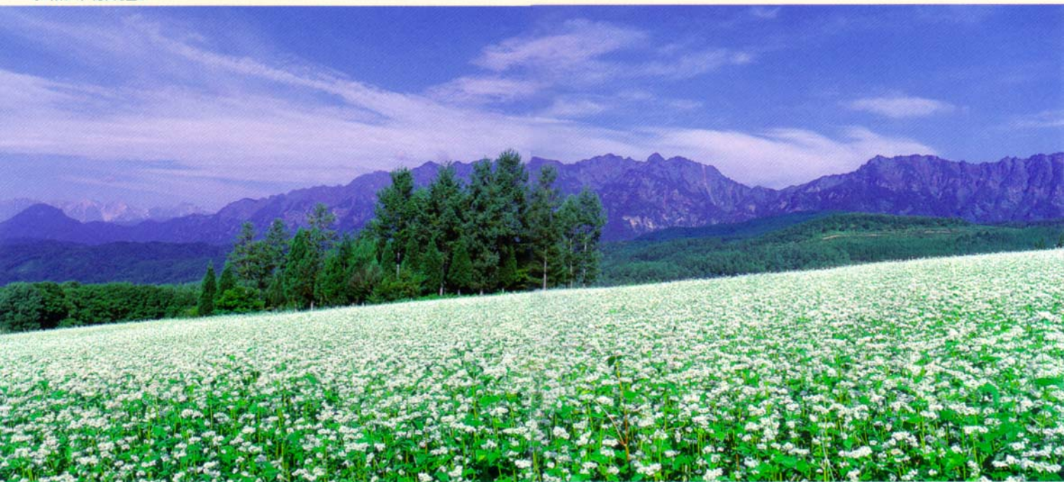
そば畑より戸隠山を望む

水の神・九頭竜に守られて、 ゆつくりと時を刻んできた戸隠の里。 伝説の神が眠るとされる戸隠山は、 澄みわたる雪解け水をたたえ、 豊かな自然そして 上質のそばを育みます。 神に守られ、 昔から変わらぬ清き水の流れこそが 戸隠・霧下そばの命です。 戸隠高原の大自然の中、 清き水で打ちあげた元祖・手打ちそばを お召し上がりください。